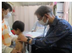
背骨の歪みチェック