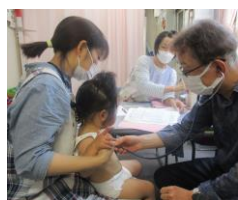
聴診器で心音確認