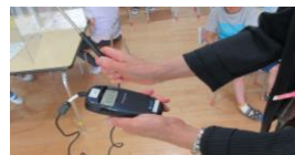
空気中の 二酸化炭素濃度の測定