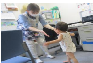
歩行は安定してきたかな？