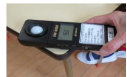
部屋の明るさ測定