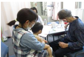
予防接種は すすんでいるかな？